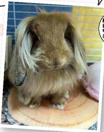
奥州市 ぎくちさんの ちゃちゃ (女の子・6ヶ月)