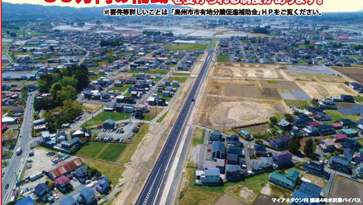
マイアネタウン内 国道4号水沢東バイパス