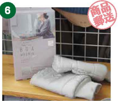
6 Oh!Shun編集室 Rela Time BOAWARMER (リラタイムボアウォーマー) 《1名様》