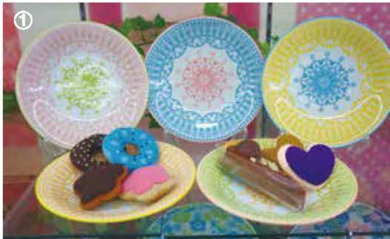
① セレクトスタッフ/あかね