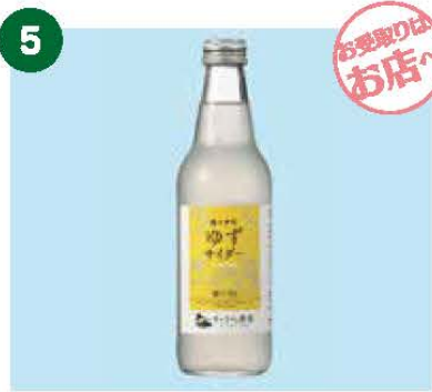
5 リカーハウス小林 甲子 ゆず サイダー 1本 《3名様》