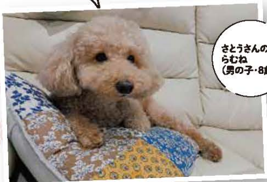
さとうさんの らむね (男の子・8歳)