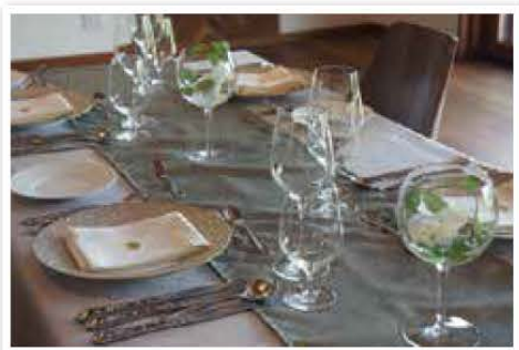
撮影場所/エルミタージュラ・メゾン