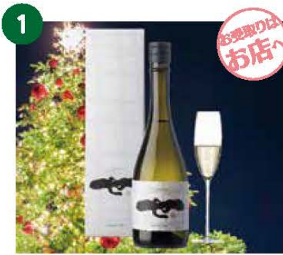
1 世壇の一酒造株式会社 スパークリング清酒 《1名様》

※当選者には1月10～15日に引換券を郵送致します。 ※写真はイメージです。 ※お食事券、引換券はおつりはできません。