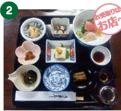
2 梅ふたつ 梅ふたつコース 《3名様》