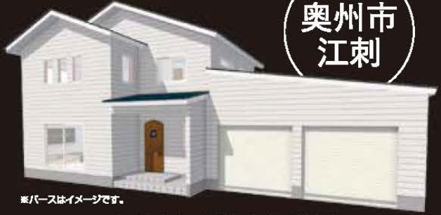
※パースはイメージです。