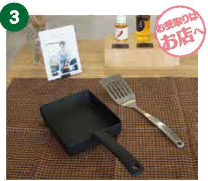
3 OIGENファクトリーショップ 鉄のたまご焼き kokotama 《1名様》