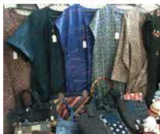
※写真はいメージです。