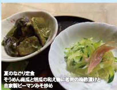
夏のなごり定食 そうめん・南瓜と胡瓜の和え物に茗荷の梅酢漬けと 自家製ビーマンみそ炒め

我が家は農家なので、野菜は畑から朝どれが当たり前だし、米も育てている。費沢な悩みだが、たくさんとれすぎて消費しきれないこともしばしば。夏場は朝晩で作業をこなし暑い日中は収穫した野菜をせっせと保存用に加工する。茗荷を刻んで冷凍したり、ウメ酢に漬け込んだり。青じそは醤油漬け、トマトは湯むきをしてシロップ漬けや玉ねぎと一緒に煮込んでトマトソースに。加工しておけばその後の食事作りが断然らくちんー飽食やフードロスが叫ばれている昨今。ありがたみが薄れないよう上手に食材と向き合いたい。主に父母が管理している田畑、ぼちぼち譲りうけることになるであろう近い将来、同じように管理ができるのだろうか。不安はたくさんあるがまずは出来る所からやってみよう!