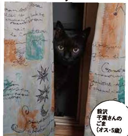
前沢 千葉さんの ごま (オス・5歳)