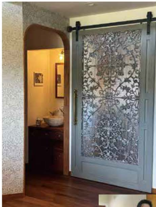
▲心と目を引くオシャレな扉

薪ストーブやウッドデッキも利用可能 全面バリアフリーで、安心の空間。自分たちだけのオリジナルウェディングを