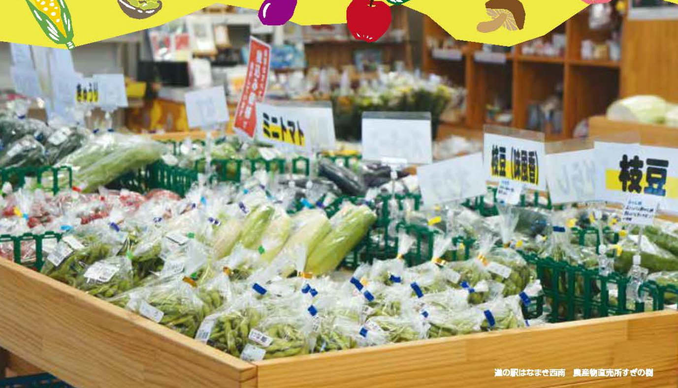
道の駅はなまき西南 農産物直売所すぎの樹

暑い中にも 少しずつ秋の足音が聞こえ始める9月 ドライブしながら 季節を感じに 生産者と消費者を繋ぐ産直へ