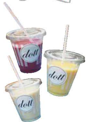
テイクアウトdott (ドット) ヘルシースムージー