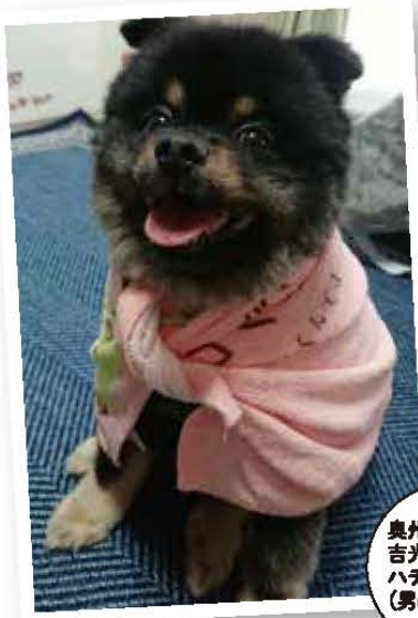
奥州市 吉光さんの ハチ (男の子・6歳)