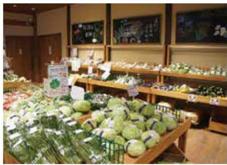
道の駅 遠野 風の丘