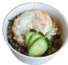
cafe Vibras (カフェ・ヴィブラス) 「ガバオライス」(上) 食の匠レストランぬくもり 「かにぱっと」(左)