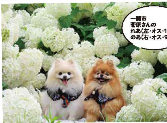
一関市 菅原さんの れあ(左・オス・12歳) のあ(右・オス・9歳)