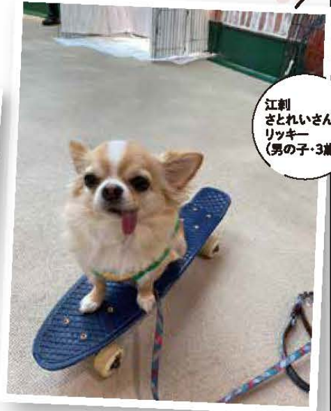
江刺 さとれいさんの リッキー (男の子・3歳)