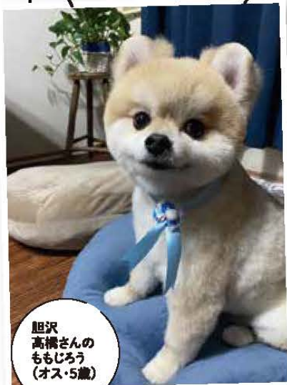
胆沢 高橋さんの ももじろう (オス・5歳)