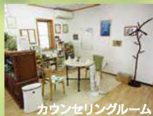
カウンセリングルーム

リトルトゥリーでは、15年の節目を機に心理援助に加えて、新たに「学習支援室」を開設しました。算数・数学が苦手な方や困っているお子さんや、教室には入れないけど勉強をしたい!という小中学生のお子さんに丁寧な個別支援を行っています。また、今まで通り、様々な事情を抱えて困っている方や自分を見つめ直したい方との面談も続けています。詳しくはHPをご覧ください。