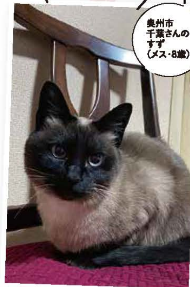
奥州市 千葉さんの すず (メス・8歳)