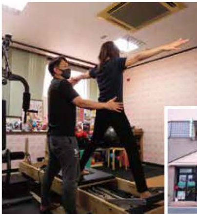
4人1人の状態に合わせて丁寧な施術とトレーニング