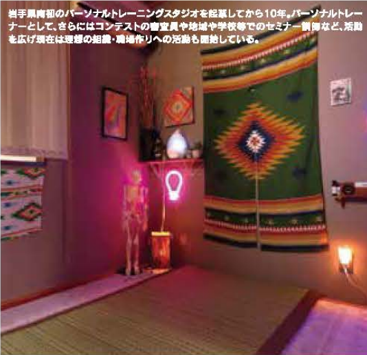
岩手県南部のパーソナルトレーニングスタジオを卒業してから10年、パーソナルトレーナーとして、さらにはコンテストの審査員や地域や学校等でのセミナー講師など、活動を広げ現在は理想の相乗・職場作りへの活動も開始している。