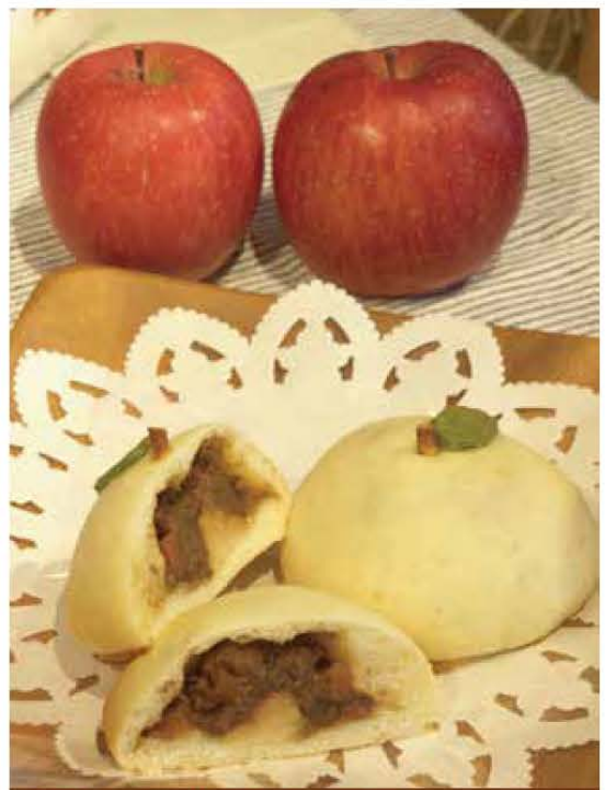
恋するカレーパン りんごの告白 ... 320円 傷などのある訳アリりんごや廃棄される酒粕、それらを材料に取り入れる事でSDGsにも取り組んだ商品

販売場所/パン工房くろしえっと ROYALジャマイ館 胆沢病院ジャマイ館 酒の小林 ※予約がおすすめ