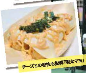
チーズとの相性も抜群「明太マヨ」

主な出店場所/コープアテルイ水沢店・ジョイス龍ヶ馬場店・DCM北上藤沢店・ロッキー江釣子店等 営業時間/10:00~17:00 出店場所によって異なる ※売切れ次第終了 支払方法/現金・クレカ・PayPay・電子マネー