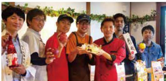
くろしえっと・ROYALジャマイ館・酒の小林・岩手銘産・マルタカリんご農園・岩瀬ファーム・つばりんご園 7人のプロがコラボ

2年前、ROYALジャマイ館とパン工房くろしえっとのコラボ商品「恋するカレーパン・キーマの誘惑」が、カレーパングランプリ2021金賞を受賞する大ヒットとなった。そして、2023年。さらにパワーアップして、新作が登場。パン生地には地元酒造の酒粕を使用。しっとりもちもちのパンの中には特産品である江刺りんごがゴロゴロ入ったカレー。ジャマイカから直輸入したカカオニブを使用したソースで、辛くないけどスパイスを感じる味になっている。パン、カレー、りんご、酒、奥州市を代表する7つの力が集結し完成したカレーパン。自信作のカレーパンで地元奥州市を盛り上げ全国へ!