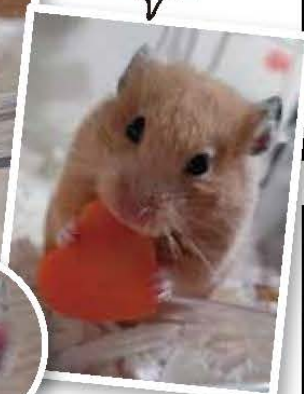
今野さんの ラテ (女の子)

あなたのおうちのペットをOh!Shunに載せませんか? 写真の送り先はこちらまで▶ staff@oh-shun.com 件名を「ポチタマ」にして送ってね! ペットのお名前・性別・年齢と、飼い主さんの苗字・居住地域も教えて下さい。