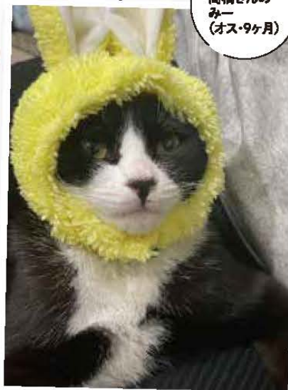
奥州市 高橋さんの みー (オス・9ヶ月)